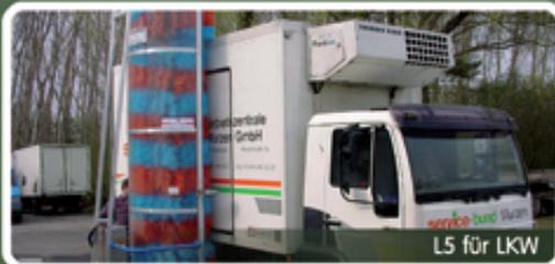
L5 für LKW