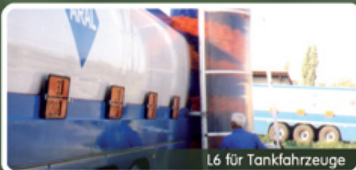
L6 für Tankfahrzeuge