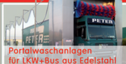
Portalwaschanlagen für LKW+Bus aus Edelstahl