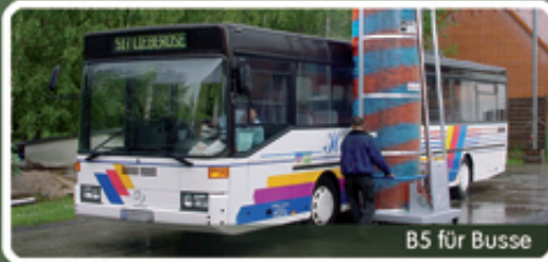
B5 für Busse