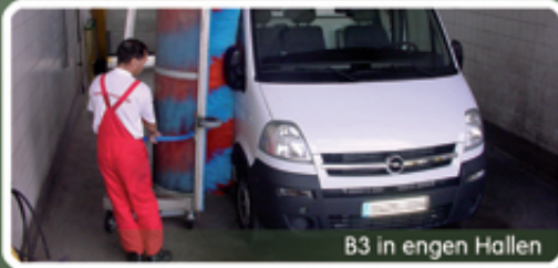
B3 in engen Hallen