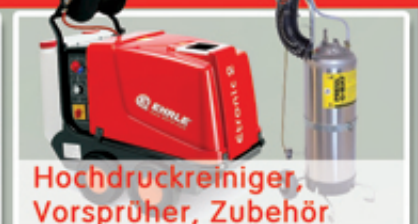
Hochdruckreiniger, Vorsprüher, Zubehör

Angebote und Infos auch in unserem „WASCHPLATZ-KATALOG“ zum downloaden auf www.truckwash.de .