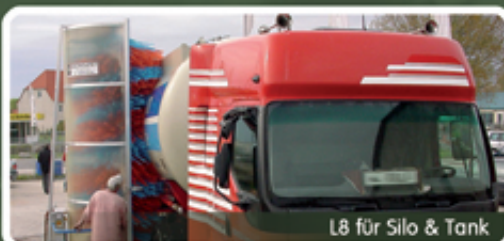
L8 für Silo & Tank